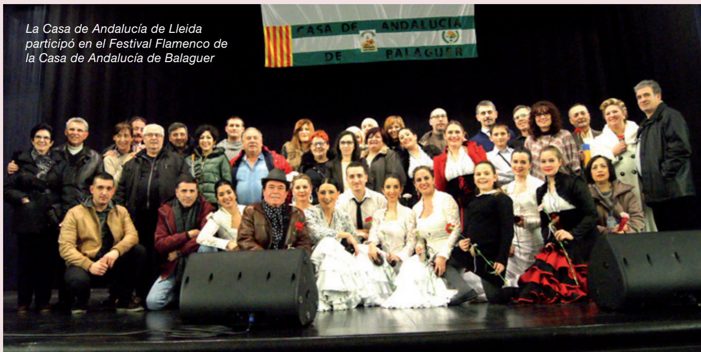
La Casa de Andalucía de Lleida participó en el Festival Flamenco de la Casa de Andalucía de Balaguer