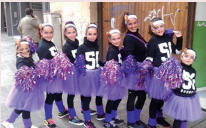
La Casa de Andalucía, presente en la Rua del Carnaval de Lleida. A la derecha, espectáculo 'Poemas musicales'