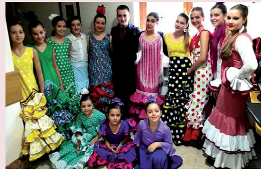
'La gitanilla' (izquierda) y actuaciones en Aitona y Sant Joan de Déu