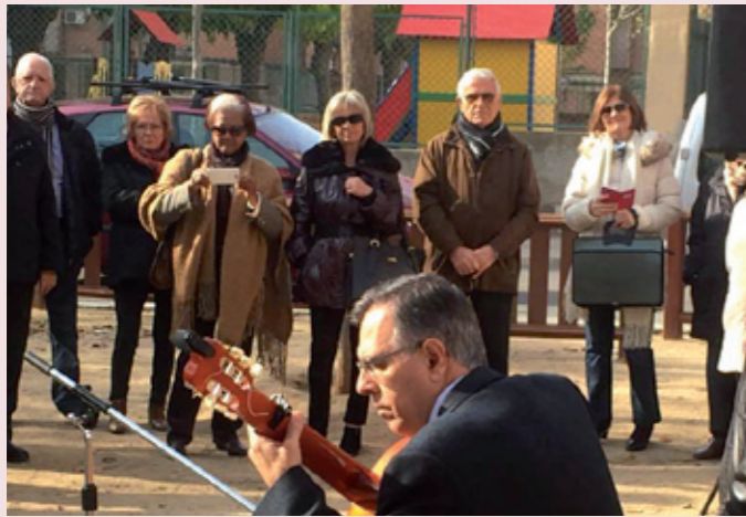
Aniversario de la inauguración de la plaza de les Cases Regionals y participación en Les Bruixes del Pont del Boc