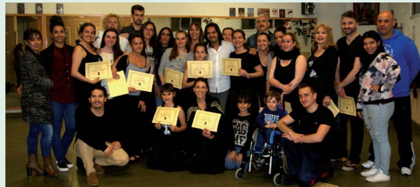
La escuela de baile de la Casa de Andalucía suma las 'masterclass' a su actividad diaria y sus actuaciones