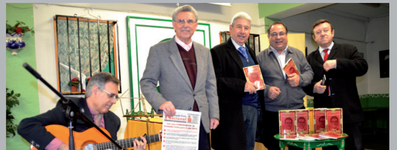
Presentación del libro 'Homenaje' en la Casa de Andalucía