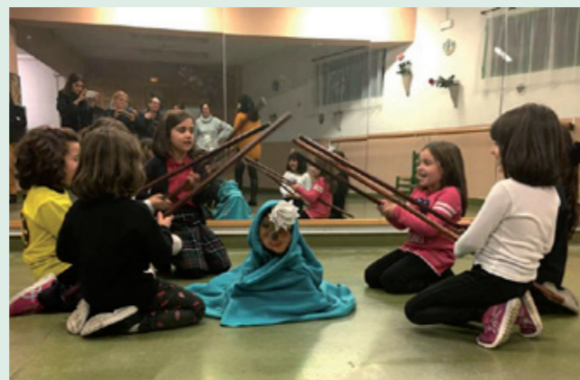
Los más pequeños de la Casa de Andalucía de Lleida disfrutaron del 'Caga Tió' la víspera de Navidad