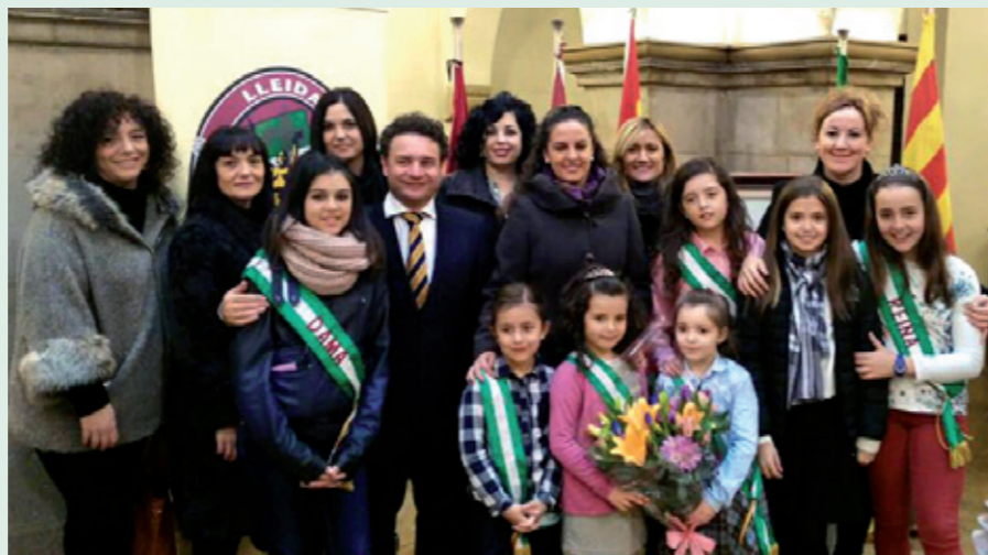
Membres de junta i socis de la Casa de Andalucía de Lleida, durant l'ofrena floral. A sota, cant de l'Himne d'Andalusia

Tot seguit, la festa va continuar a la seu de la Casa de Andalucía al barri de Cappont, on va tenir lloc el vermut popular i l'actuació dels 'Coros Rocieros' de l'entitat.