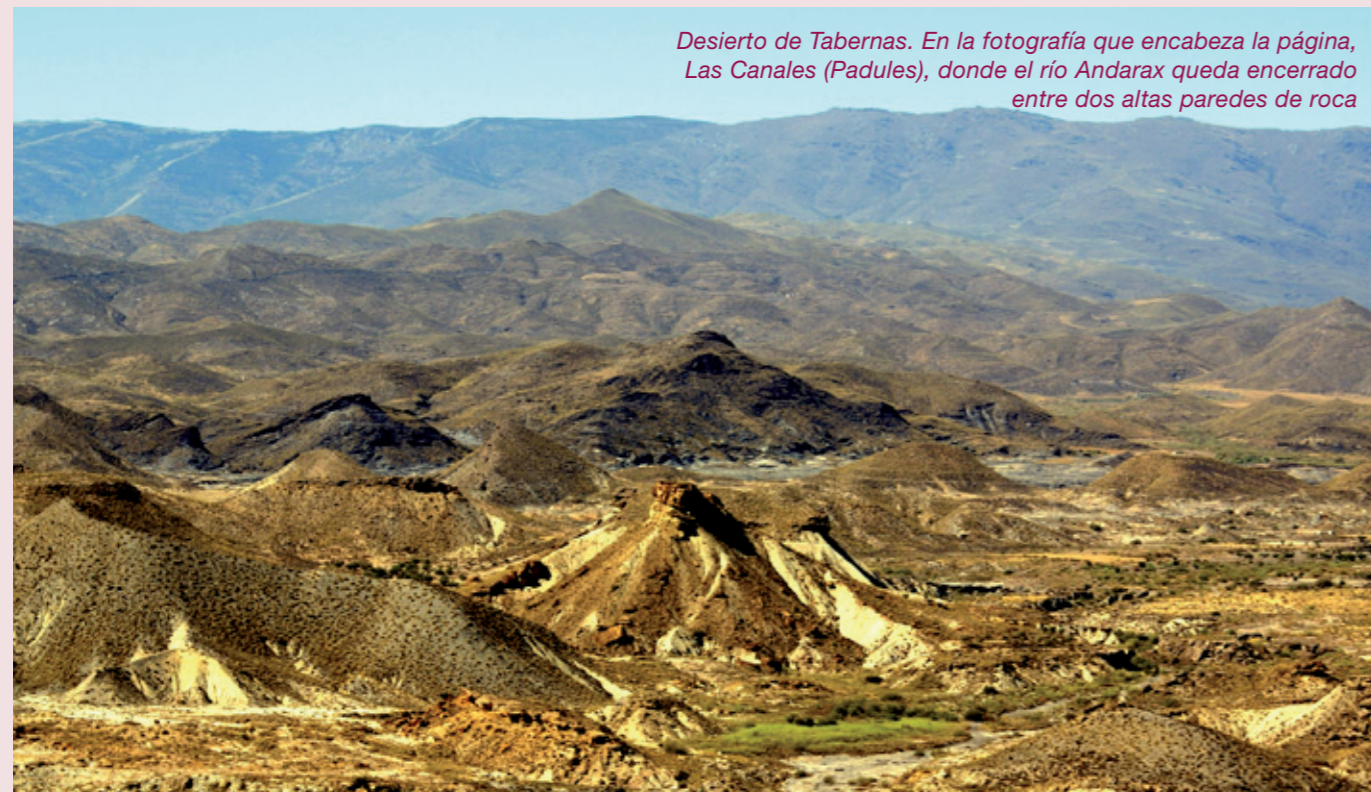
Desierto de Tabernas. En la fotografía que encabeza la página, Las Canales (Padules), donde el río Andarax queda encerrado entre dos altas paredes de roca

Así es 'Costa de Almería', un destino enigmático que cada año se coloca a la cabeza entre los 'paraísos terrenales' que meten en la maleta de cada visitante un sinfín de emociones y experiencias.