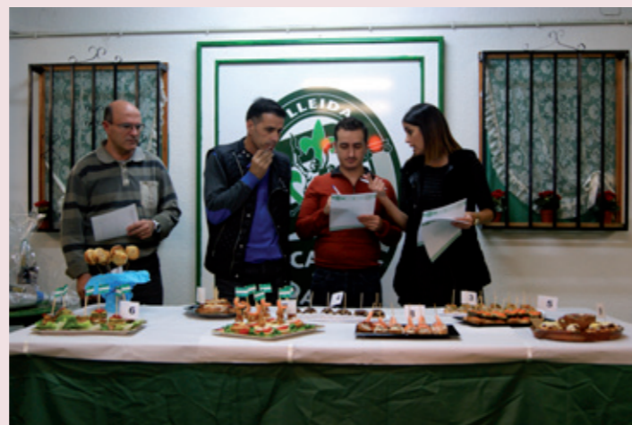
Concurso de pinchos en la Casa de Andalucía