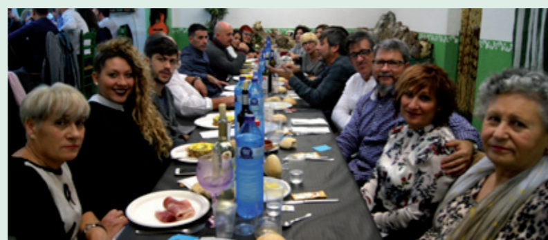
La tradicional Cena del Socio de la Casa de Andalucía reúne cada año a decenas de personas en un ambiente de hermandad