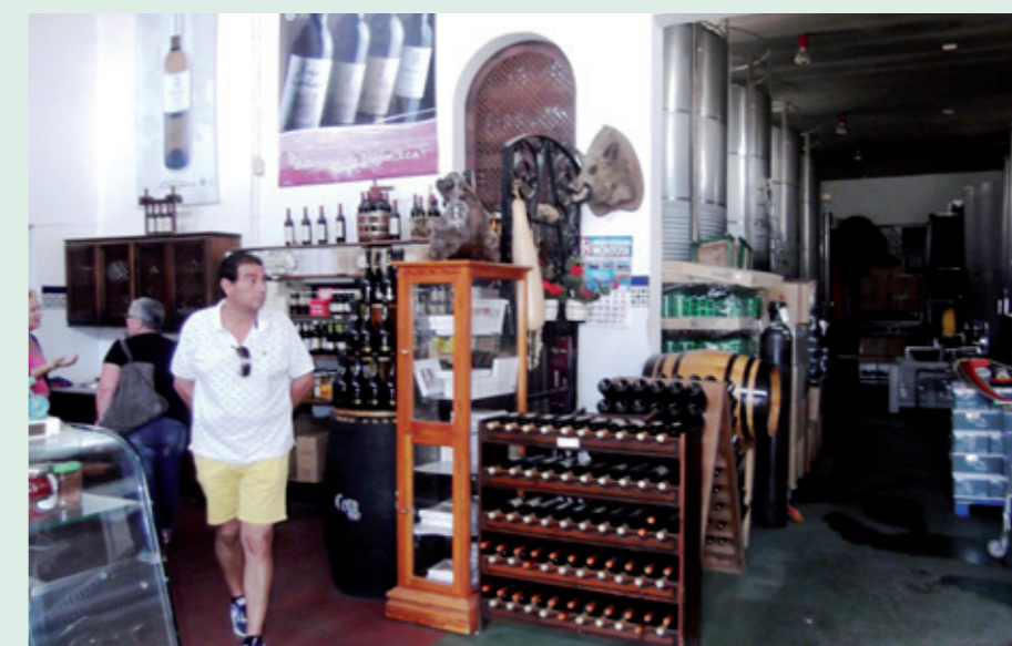
Calle de plataforma única sin aceras, típica de esta población de La Alpujarra. Debajo, placa dedicada al poeta Francisco Villaespesa, nacido en la localidad, y bodegas del Laujar

glo XVII, conocida como la "Catedral de La Alpujarra"; la Ermita de la Virgen de la Salud del siglo XVIII y el magnífico edificio neoclásico del Ayuntamiento, construido en 1792, bajo el reinado de Carlos IV, por el arquitecto Francisco Quintillán Lois.