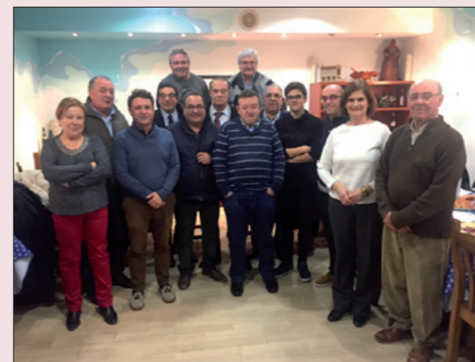
Cena de los miembros de la Federación (izquierda) y cena de clausura de las Jornadas Intercentros (derecha)

Desde mi amplia experiencia en este conglomerado asociativo, creo que estoy capacitado para afirmar que las Casas y Centros Regionales, desde nuestra ciudad de Lleida, deben ser hoy en día para todos nosotros una ventana abierta de nuestra comunidad de origen a través de las actividades, difusión turística, empresarial y gastronómica. Sin duda, eso es transmitir cultura de esos pueblos, ciudades, villas, provincias o autonomías, y nosotros lo hacemos muy