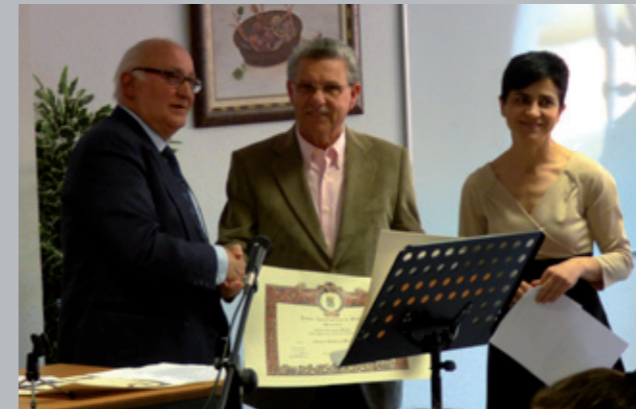
Diploma en el Ayuntamiento de Itrabo