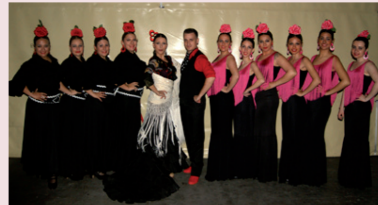
Participación de los grupos de baile de la Casa de Andalucía en la Feria de Abril de Fraga y fin de curso de la escuela