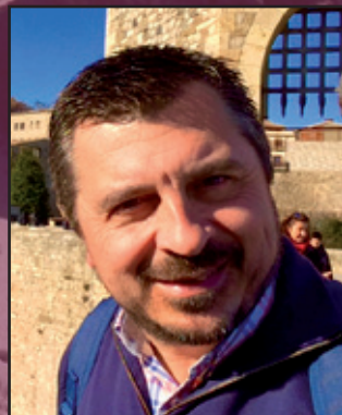
Toni Martín Andaluz del Año 2017 - Premio a la Concordia

XXXVI JORNADAS CULTURALES CONMEMORATIVAS DEL DÍA DE ANDALUCÍA