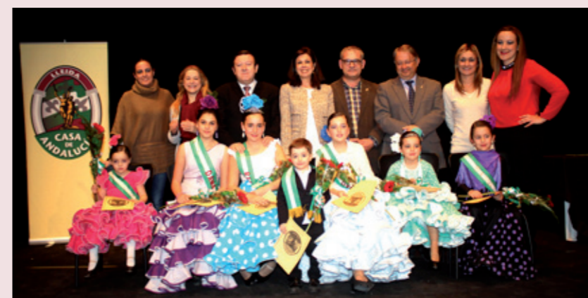
Imposición de bandas a las reinas y damas de la Casa y Noche Flamenca con las mejores voces del flamenco de Lleida