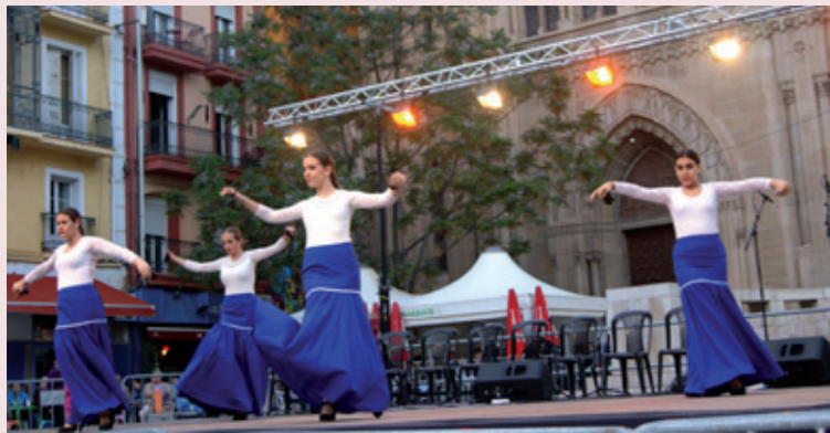
Actuación en la plaza Sant Joan durante las Festes de Maig de Lleida y participación en la fiesta de San Pantaleón