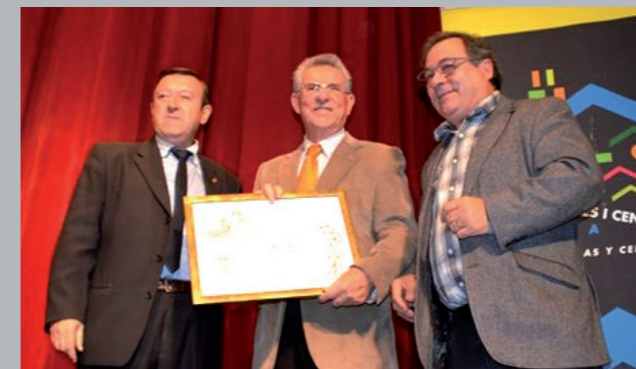
Homenaje de la Federación de Casas Regionales