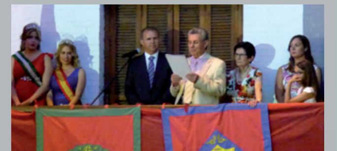
Pregonero en las fiestas de Vélez de Benaudalla