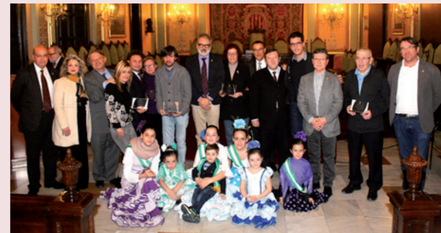
Pregón de las Jornadas y reconocimiento a los onubenses residentes en Lleida

Las Jornadas Culturales que la Casa de Andalucía de Lleida organiza con motivo del Día de Andalucía se convierten cada año en una puerta abierta a la ciudad, a la que se hace partícipe de la actividad organizada durante esos días. Las Jornadas de 2016, dedicadas a Huelva, se iniciaron con la lectura del pregón en la Sala de Plenos de la Paeria a cargo de Ignacio Caraballo Romero, presidente de la Diputación de Huelva. La imposición de bandas a las reinas y las damas de la Casa de Andalucía, conferencias, clases de baile, espectáculos flamencos, misas rocieras y el concurso de migas completaron el programa del pasado año.