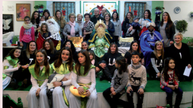
Celebración de las Águedas en la Casa de Andalucía

Nuestra misión es muy simple y a la vez compleja, agarrando el volante para llevar a nuestra Casa y a todos sus so-