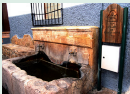
Fuente de la plaza del Laujar (fotografía superior). Debajo, Cañillo La Mateana y Fuente Nueva, el pilar más cercano de la casa del poeta Francisco Villaespesa. A la derecha, Pilar de San Antonio

Igualmente, nos indica que es digno de admirar en el Laujar la arquitectura alpujarreña y su patrimonio histórico-