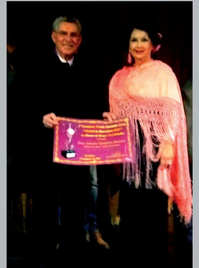
Primer premio del certamen poético Ciudad de Barcelona