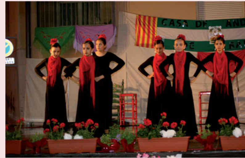
La Casa de Andalucía de Lleida estuvo presente en la Feria de Abril de Balaguer y en un festival en Massalcoreig