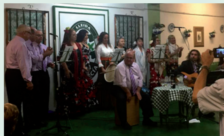
Halloween, Carnaval y Reyes son tres de las celebraciones más participativas. A la derecha, concierto del Coro Romero y Jara