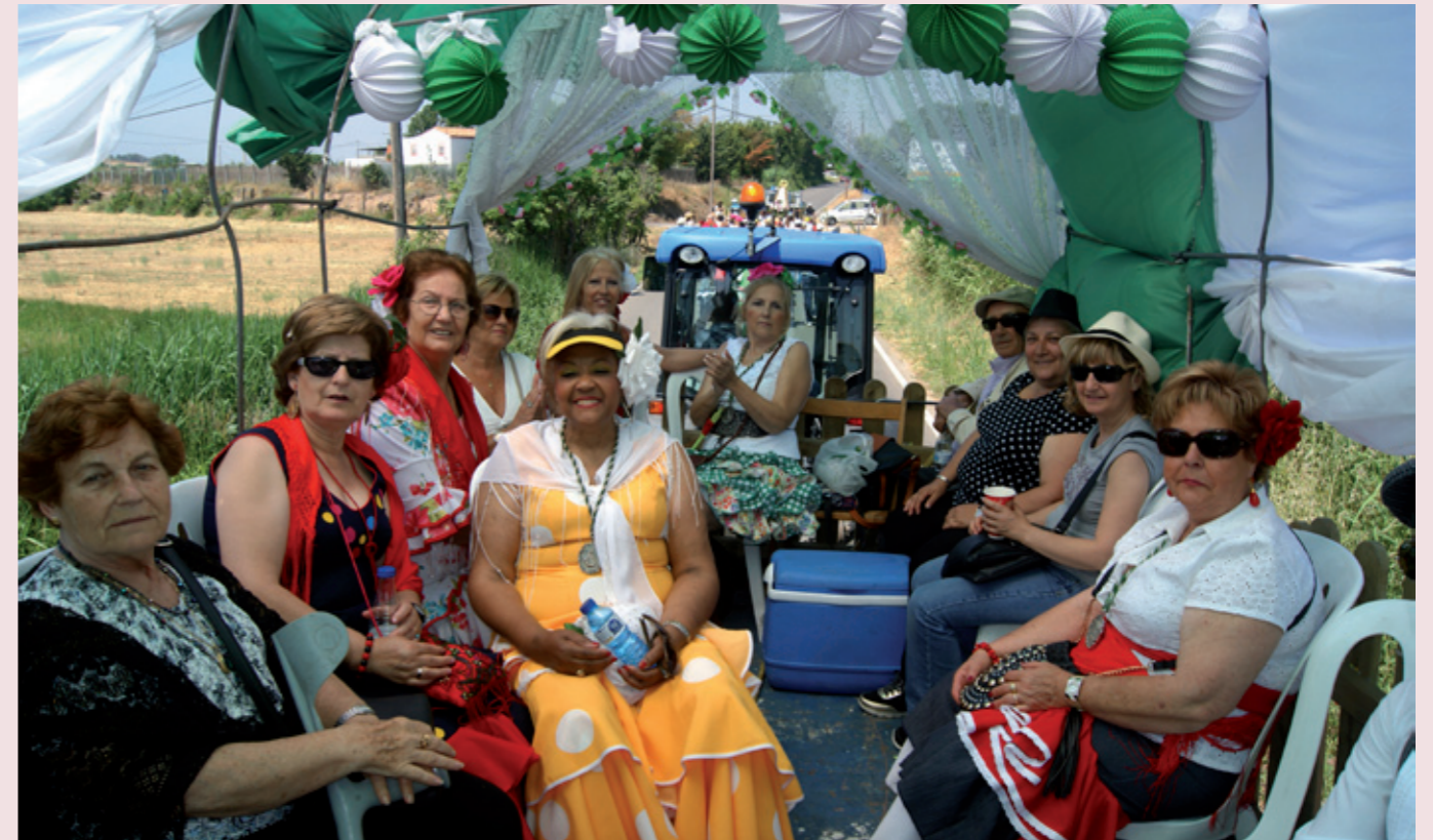
Diferents moments de la romeria de la Virgen del Rocío de l'any 2016, amb el recorregut pels carrers de Lleida a peu, a cavall o amb carretes des de l'església de Sant Martí fins al Parc de Serra Llarga. Dissabte a la nit, balls a la llum de la candela.