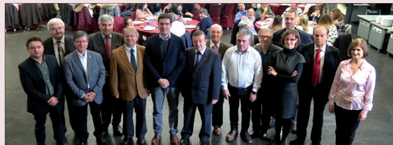
Autoridades de casas regionales, autoridades y el presidente de la Federación, en la cena de las Jornadas en Mercolleida

Vicepresidente de la Confederación Española de Casas y Centros Regionales y Provinciales y presidente de la Federación en Lleida